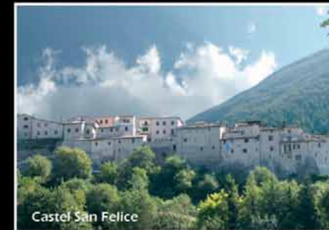
Castel San Felice

Associazione Culturale i 2 colli Torre Orsina (TR)