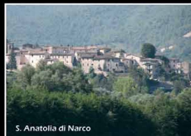
S. Anatolia di Narco